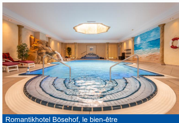
Romantikhof Bösehof, le bien-être