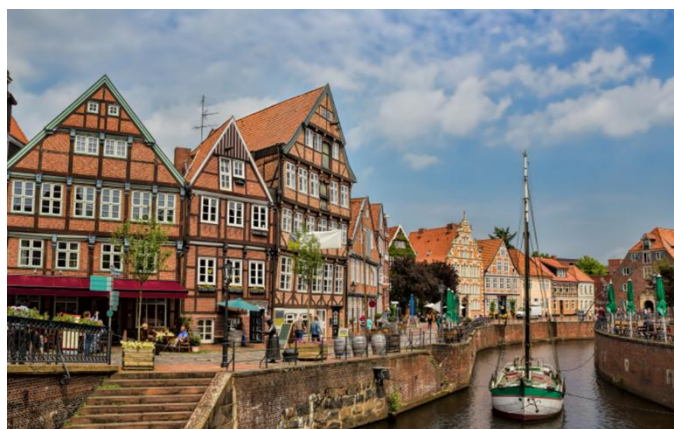
Vieille ville de Stade