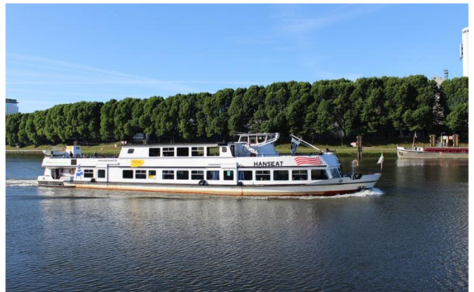
Sur la Weser vers Brême