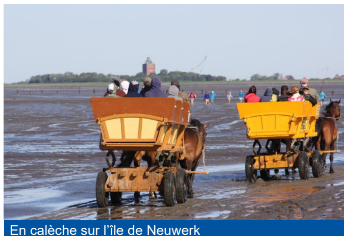
En calèche sur l'île de Neuwerk

Sous réserve d'un échange entre les journées d'excursion. Les excursions dans la mer des Wadden