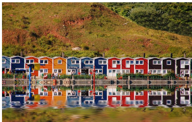
Helgoland, les baraques à homards colorées