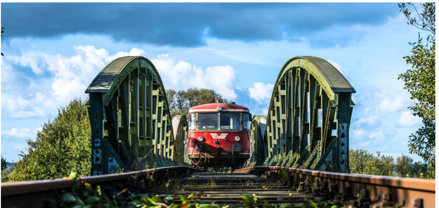
Le Moorexpress en route entre Brême et Stade