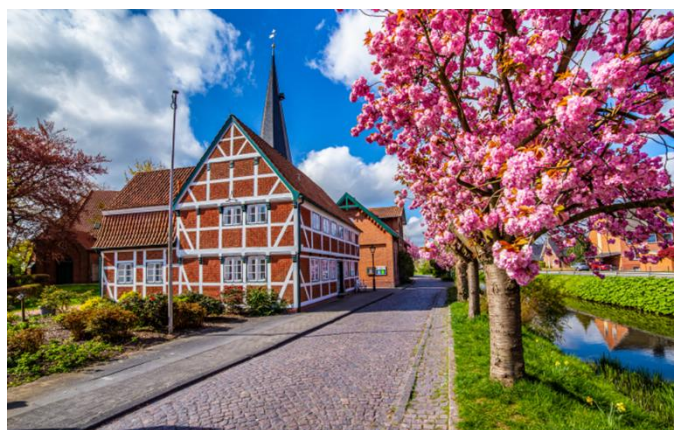
« Altes Land » (Le Vieux Pays)