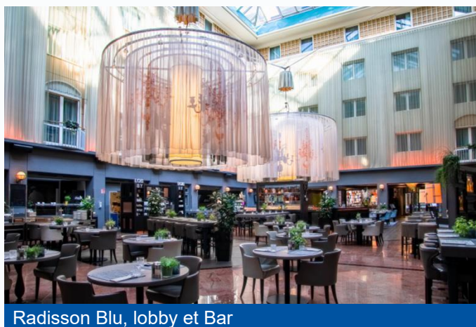
Radisson Blu, lobby et Bar