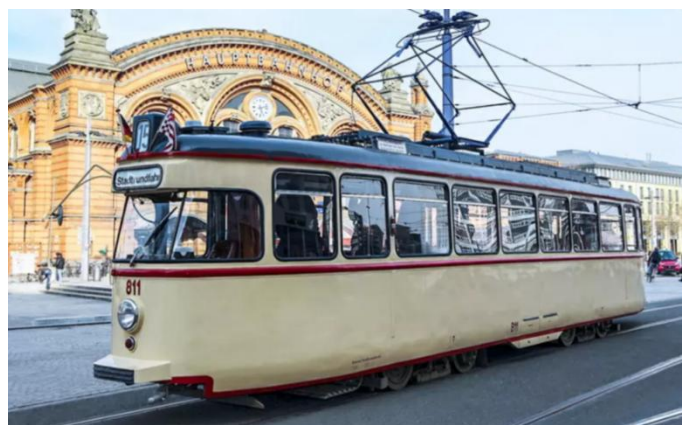
Brême, tramway historique