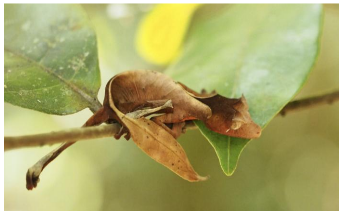
Gecko à queue feuilletée