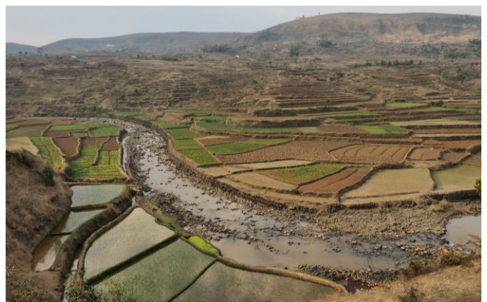
Rizières en terrasses