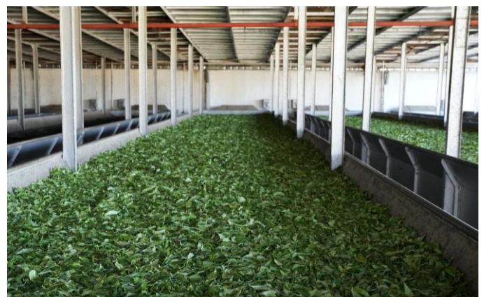
Fabrique de thé à Sahambavy