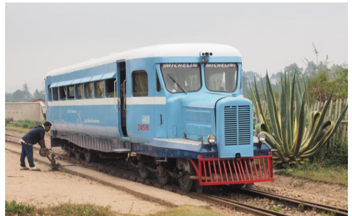
Bus à rails Micheline