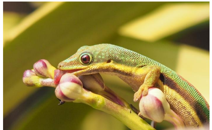
Gecko de Madagascar