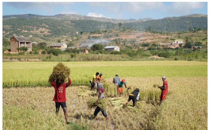
Récolte du riz