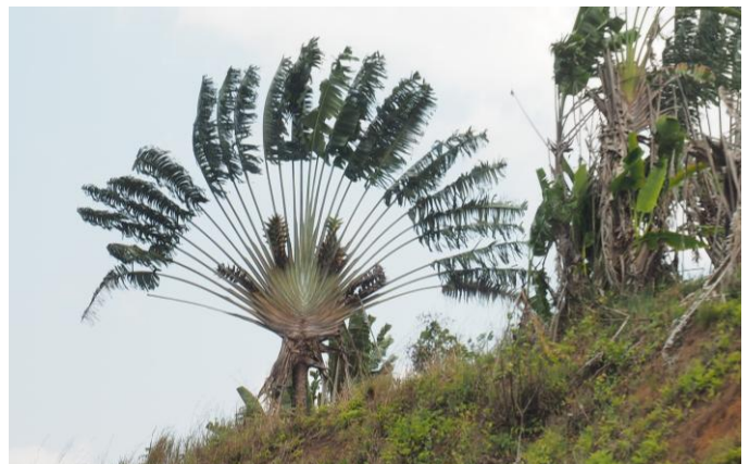
Arbre du vagabond