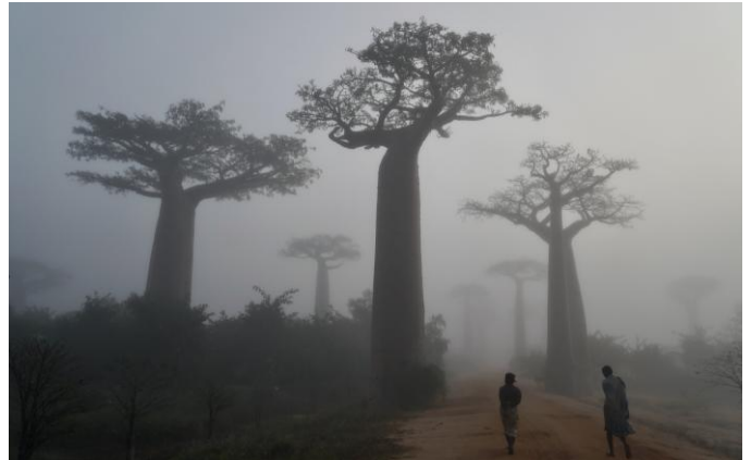
Lever du soleil sur l'allée des baobabs