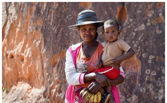
Madégaque avec enfant