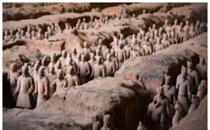
Armée de terre cuite