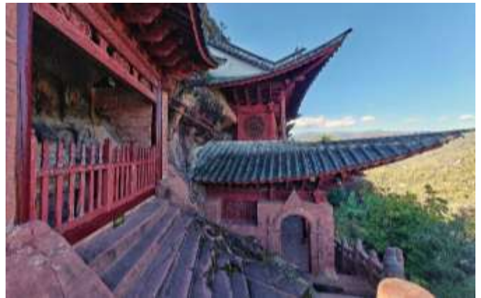
Temple de Shibashan

Visite de la célèbre armée de terre cuite de l'empereur Qin Shi Huang, l'un des trésors historiques les plus précieux de Chine. Ces soldats, chevaux et chars en argile, grandeur nature et sculptés individuellement, représentent un patrimoine vieux de 2 200 ans. Découverts en 1974, ils sont inscrits au patrimoine mondial de l'UNESCO. Participez ensuite à un atelier de calligraphie.