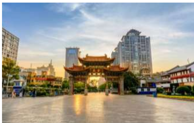
« Jinbi square » à Kunming