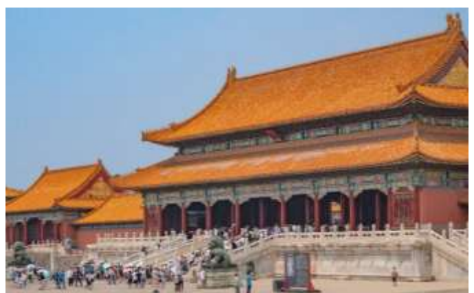
La Cité interdite