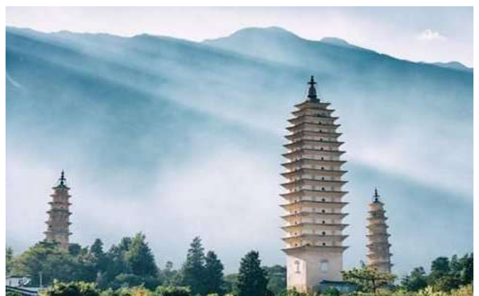
Le temple des pagodes à Dali