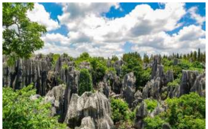
La forêt de pierres noires