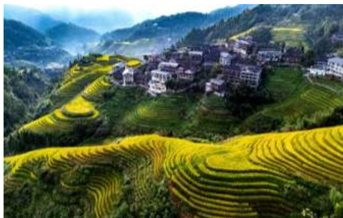
Rizières de Longsheng