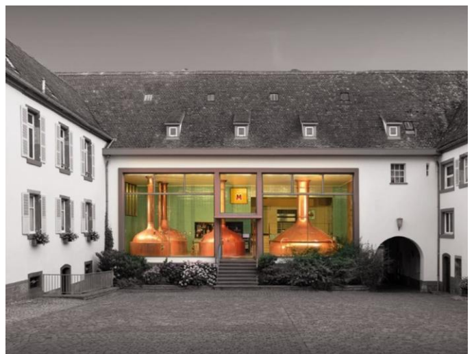
Villa Meteor - Hochfelden