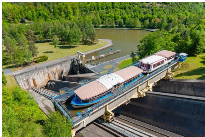
Plan incliné d'Arzwiller