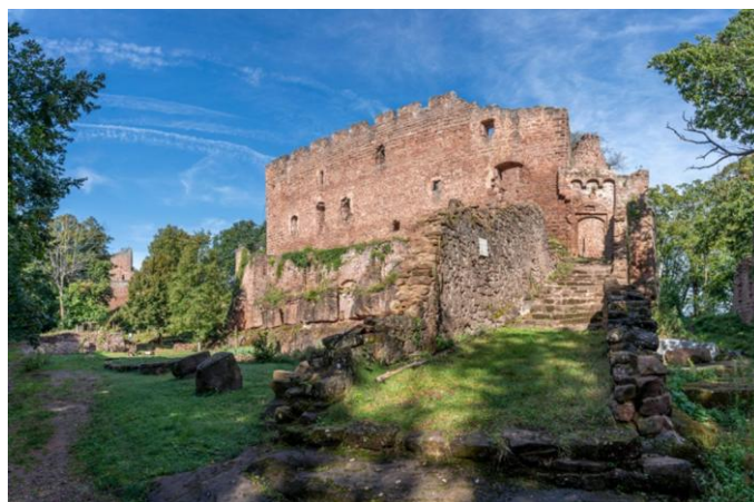
Ruines du château de Lutzelbourg