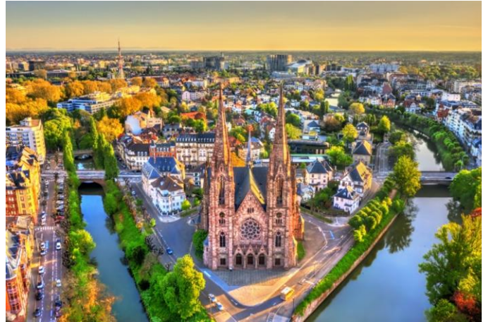
Strasbourg – cathédrale de Notre-Dame

Le matin, navigation sur le canal Rhin-Marne jusqu'à Weltenheim sur la Zorn. Mis en service en 1853, le canal a été construit en même temps que la ligne ferroviaire Paris-Strasbourg. Après le départ de Strasbourg, vous traverserez la plaine d'Alsace jusqu'à la vallée de la Zorn. Dans l'après-midi, excursion dans la région vallonnée du Kochersberg. Autrefois considérée comme le « grenier » de Strasbourg, cette région recèle de véritables trésors. Des champs à perte de vue, de grandes fermes et, bien sûr, les maisons à colombages typiques. À Truchtersheim, vous visiterez la Maison du Kochersberg. Ce musée des arts et traditions populaires rend hommage au patrimoine local, à ses coutumes et traditions, à ses objets anciens et contemporains à travers des expositions temporaires. Vous poursuivrez ensuite votre route vers Hochfelden pour visiter la Villa Meteor. La plus ancienne brasserie de France vous ouvre les portes de son musée. Un lieu à forte valeur culturelle où vous découvrirez toutes les étapes et tous les outils de fabrication de la bière Meteor, des machines anciennes aux nouvelles technologies. Dégustation de bière à la fin de la visite.