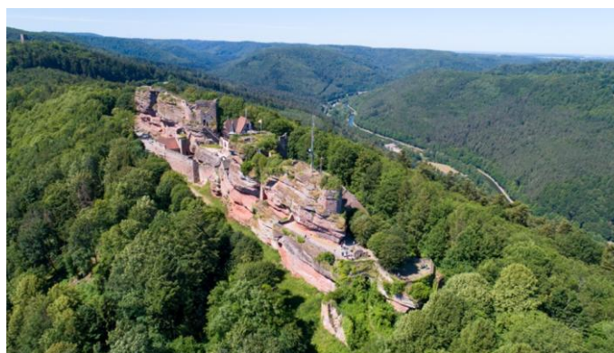
Ruines médiévales de Haut-Barr