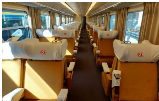
Notre voiture «dorée»