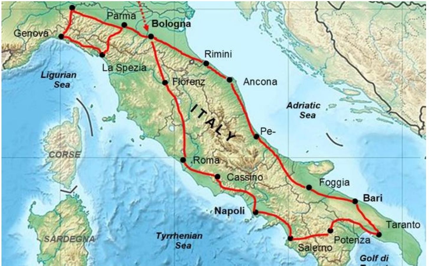
Nous découvrons (presque) toute l'Italie