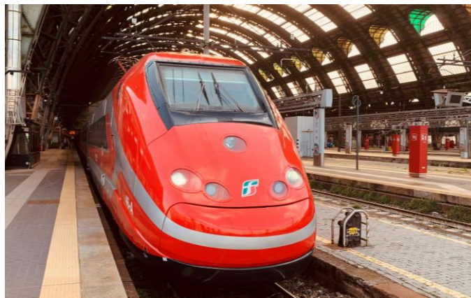
Le Frecciarossa à Milano Centrale, peu avant le départ