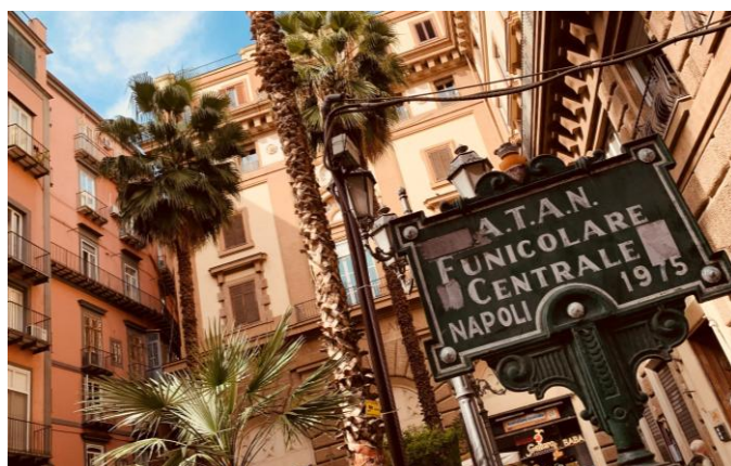
Station du funiculaire à Naples