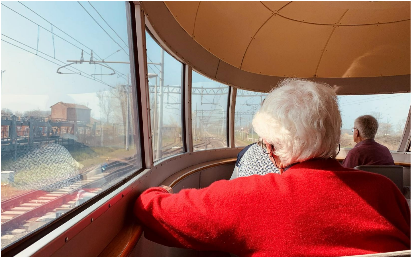
Vue depuis la tribune (11 places à l'avant et 11 à l'arrière)