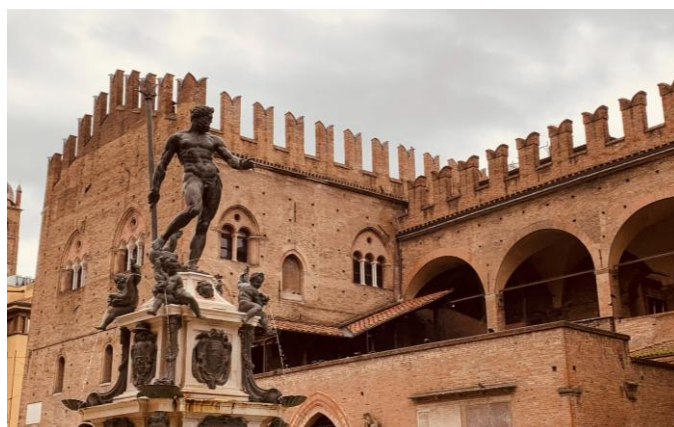
Centre historique de Bologne