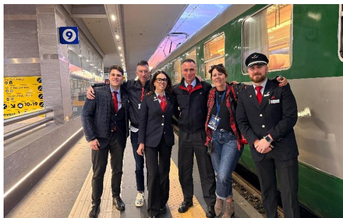
Une équipe compétente à l'Arlecchino

Naples, troisième plus grande ville d'Italie, est située dans un cadre pittoresque au bord du golfe de Naples, au pied du Vésuve. La ville, forte d'une histoire de plus de 2 500 ans, est considérée comme le cœur culturel du sud de l'Italie. Son centre historique, classé au patrimoine mondial de l'UNESCO, séduit par ses ruelles étroites, ses églises baroques, ses palais historiques et son animation de rue. C'est ici qu'a été inventée la pizza Margherita. Outre ses trésors archéologiques, comme le Musée national archéologique, la ville est également le point de départ d'excursions vers Pompéi, la côte amalfitaine ou l'île de Capri. Avec son mélange unique d'histoire, de culture, de chaos et de charme, Naples est une ville pleine de contrastes – vivante, passionnée et absolument fascinant.