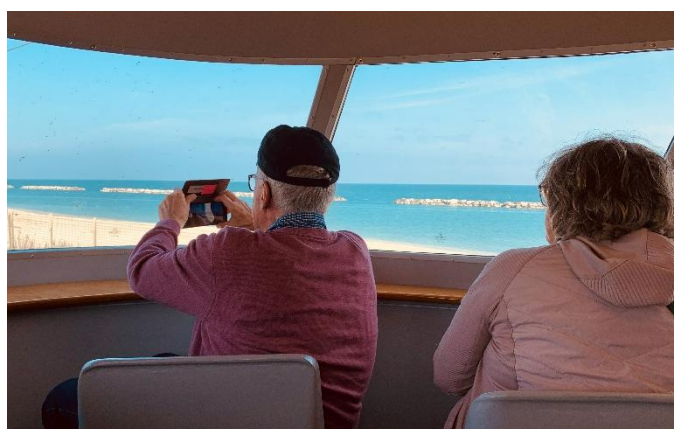
Vue depuis la chaire