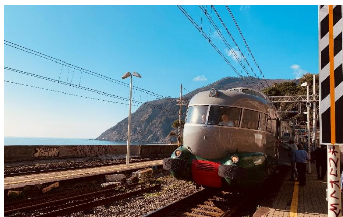
Pause photo au bord de la mer Ligure