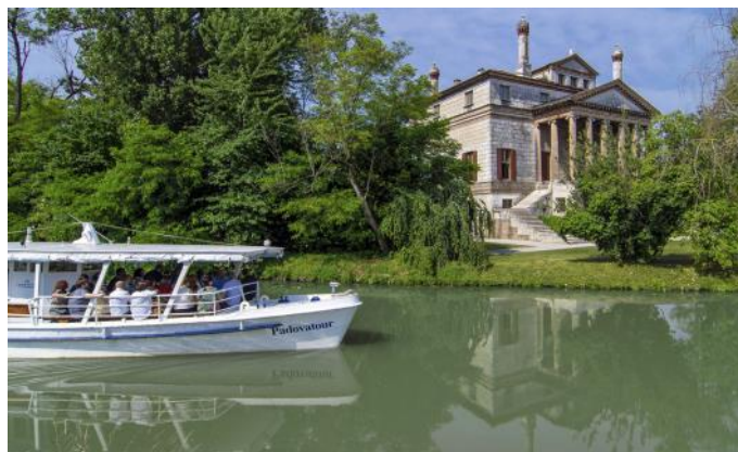
Mit dem privaten Extraboot auf der Brenta

Anlässlich unserer Reise treffen wir am zweiten und am vierten Tag auf diesen Fluss. Am zweiten Tag folgen wir mit dem Zug der Brenta und besichtigen in Bassano die Holzbrücke. Am vierten Tag reisen wir im Kanalboot auf dem Brenta-Kanal bis nach Padua.