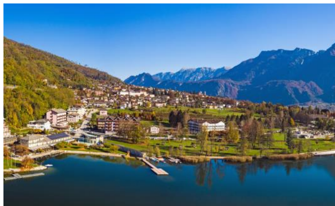
Valsugana - Blick auf Levico Terme

Mittagessen in Bassano del Grappa und Übernachtung in Treviso für drei Nächte