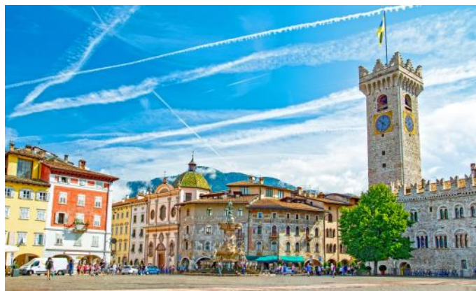
Die Altstadt von Trento

Abendessen im Hotel und Übernachtung in Trento.