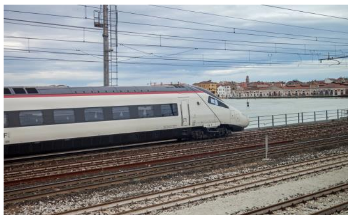
Fahrt im EUROCITY-Zug zurück in die Schweiz

Bitte besorgen Sie sich Ihr eigenes Billett an Ihrem Bahnhof. Das GA ist ab Chiasso bzw. Domodossola gültig.