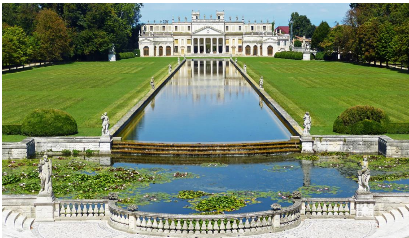
Grossartige Villen an der Brenta