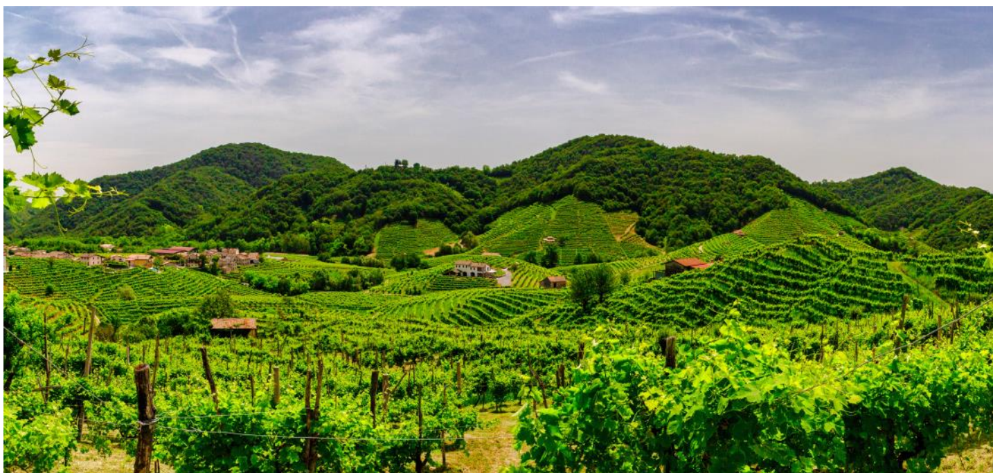
Malerisches Prosecco Weingebiet