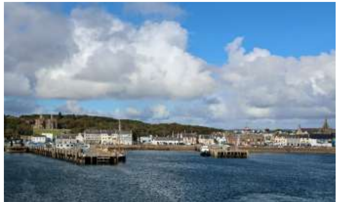
Blick auf Stornoway mit dem Lews Castle