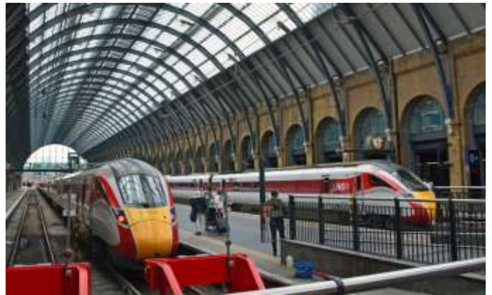
Fahrt mit modernen Zügen durch Grossbritannien

Verpflegung im Eurostar und im LNER Zug im Rahmen der von den Bahngesellschaften angebotenen Mahlzeiten. Übernachtung in Leeds.