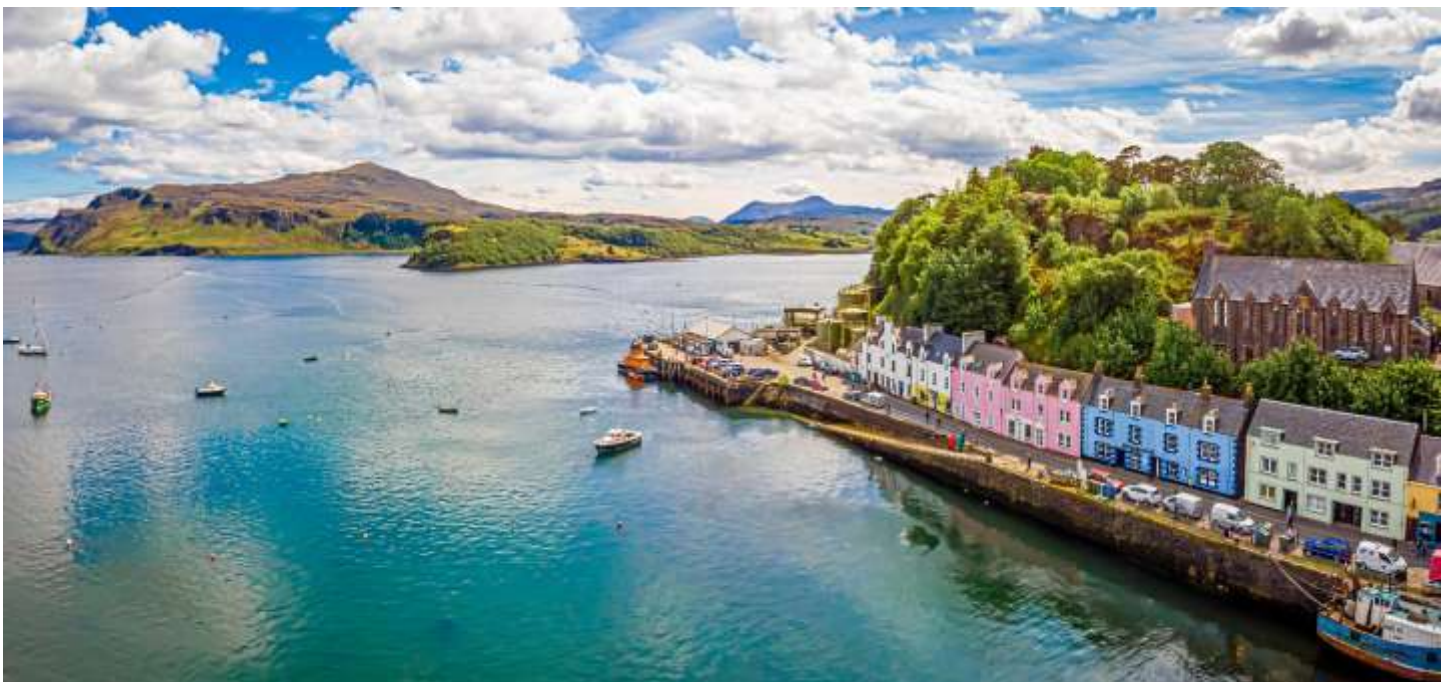
Inseldorf Portree auf Skye