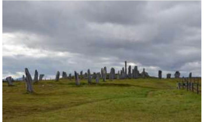
Die «Callanish Standing Stones» auf der Insel Lewis

Wir fahren zurück auf das schottische Festland nach Kyle of Lochalsh. Dabei überqueren wir bei Kyleakin mittels einer grossen Brücke, das Loch Alsh. Nochmals eine grossartige Bahnstrecke, wir reisen im Zug von Kyle of Lochalsh nach Inverness. Die Fahrt führt entlang von Seen und Flüssen durch eine typisch schottische Landschaft. Am Nachmittag fahren wir weiter im Zug entlang der Nordsee Küste und über Elgin - Keith nach Aberdeen.