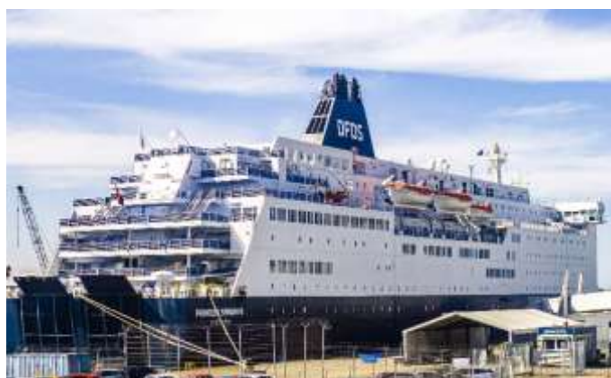
Rückreise mit der Fähren von DFDS