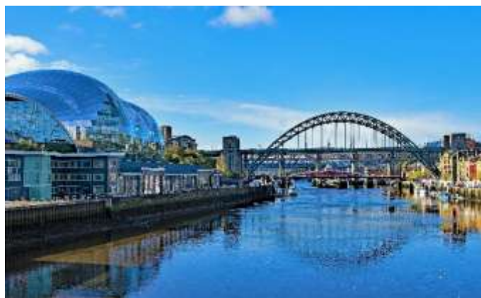
Brückenstadt Newcastle am River Tyne

Änderungen des Programms bleiben ausdrücklich vorbehalten!