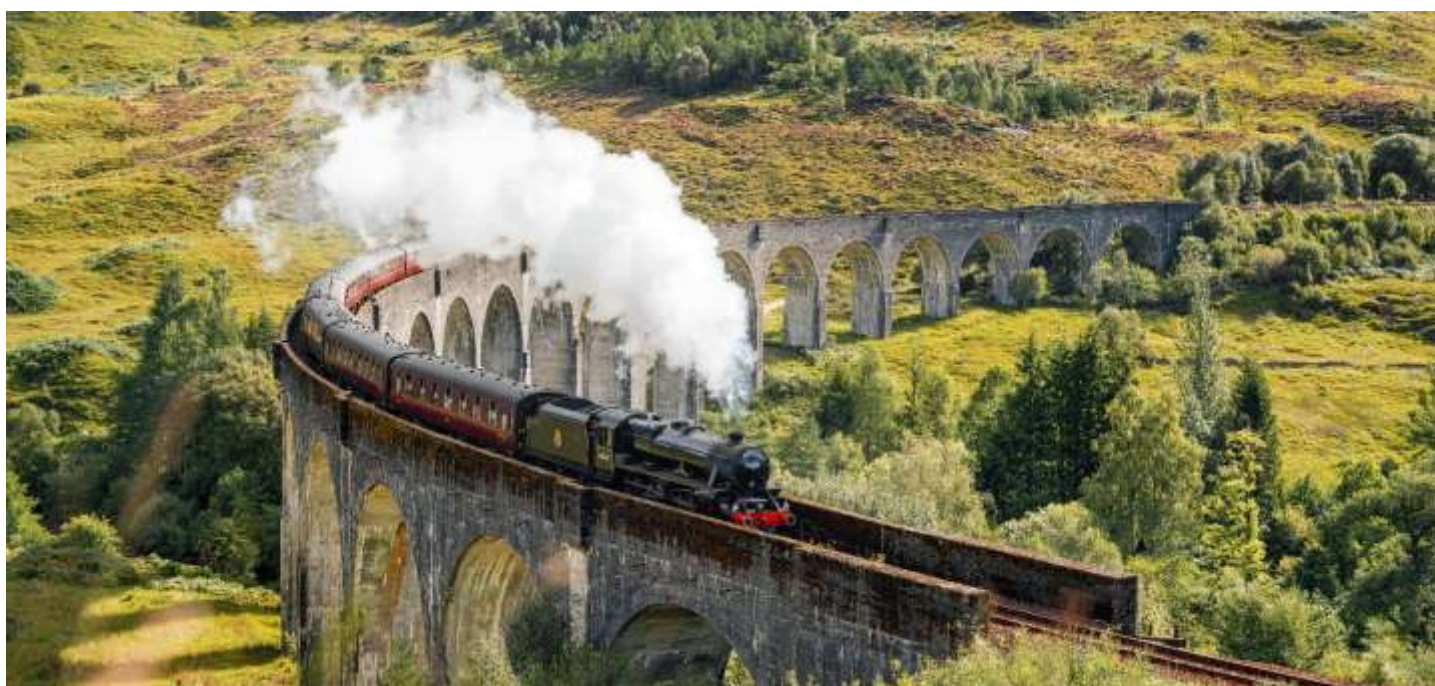
Dampfzug «The Jacobite» - Glenfinnan Viadukt