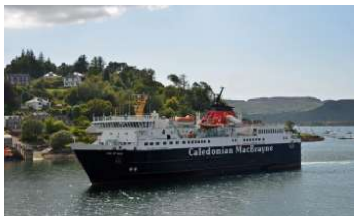
Fähre von CALMAC (Mallaig - Lochboisdale)

Am Vormittag fahren wir mit dem Car auf der gleichen, landschaftlich besonders schönen, Route zum Glenfinnan Viadukt. Hier können wir den Dampfzug bei der Fahrt über den legendären Viadukt fotografieren oder filmen. Am Nachmittag besteigen wir in Mallaig die Fähre von «Caledonian MacBrayne» (CALMAC) und gleiten durch den Cuillin Sound nach der Insel South Uist. Ankunft am Abend in Lochboisdale. Die Insel