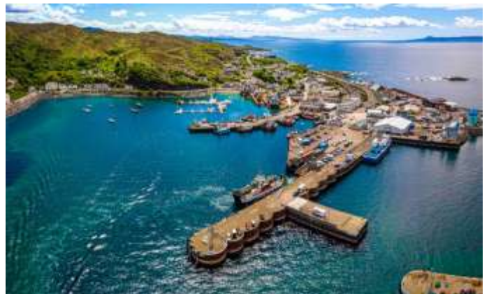
Blick auf Hafen und Bahnhof von Mallaig

Abendessen im Hotel und Übernachtung in Mallaig.