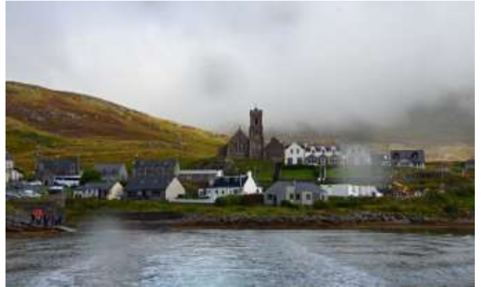
Geheimnisvolles Castlebay (Insel Barra)

Abendessen im Hotel und Übernachtung in Stornoway für zwei Nächte.