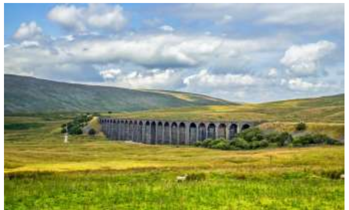
Der Ribbleshead Viadukt (Settle & Carlisle Line)

Abendessen im Hotel und Übernachtung in Glasgow.