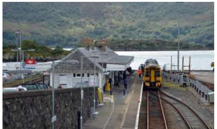
Bahnhof Kyle of Lochalsh