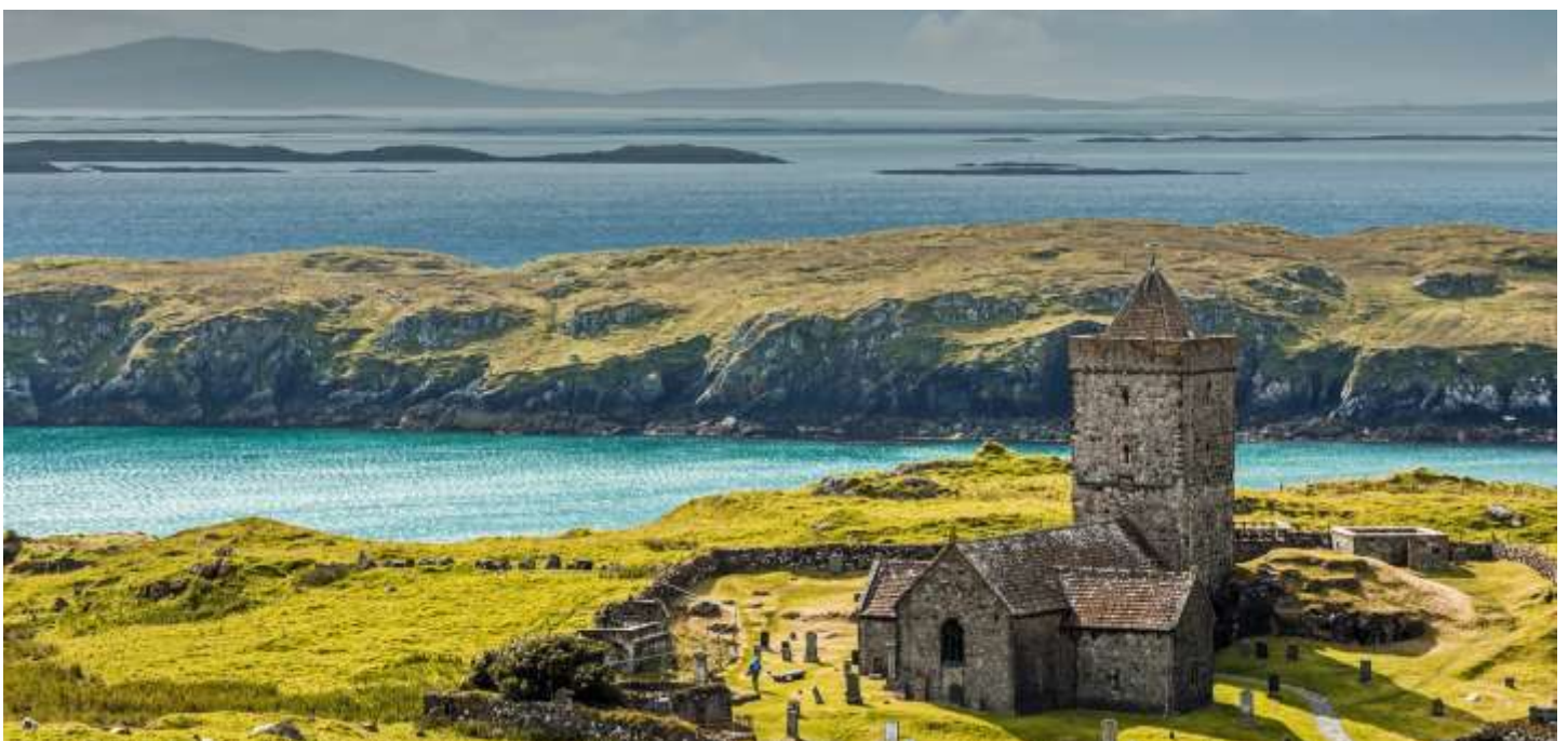
Insel Harris - St Clements Church