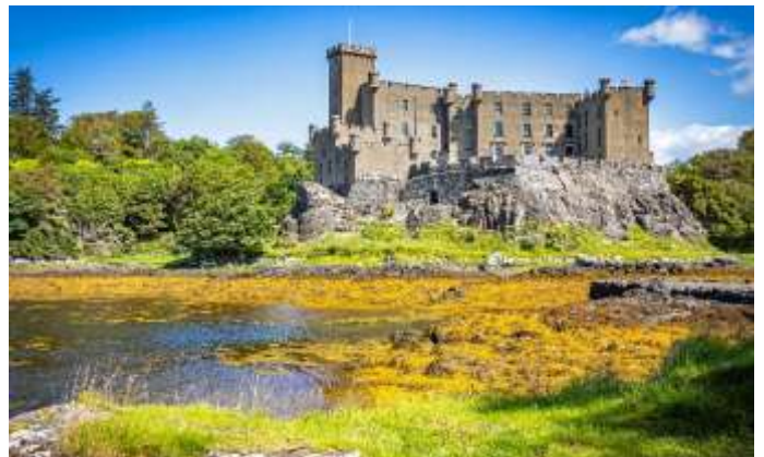
Dunvegan Castle auf Skye